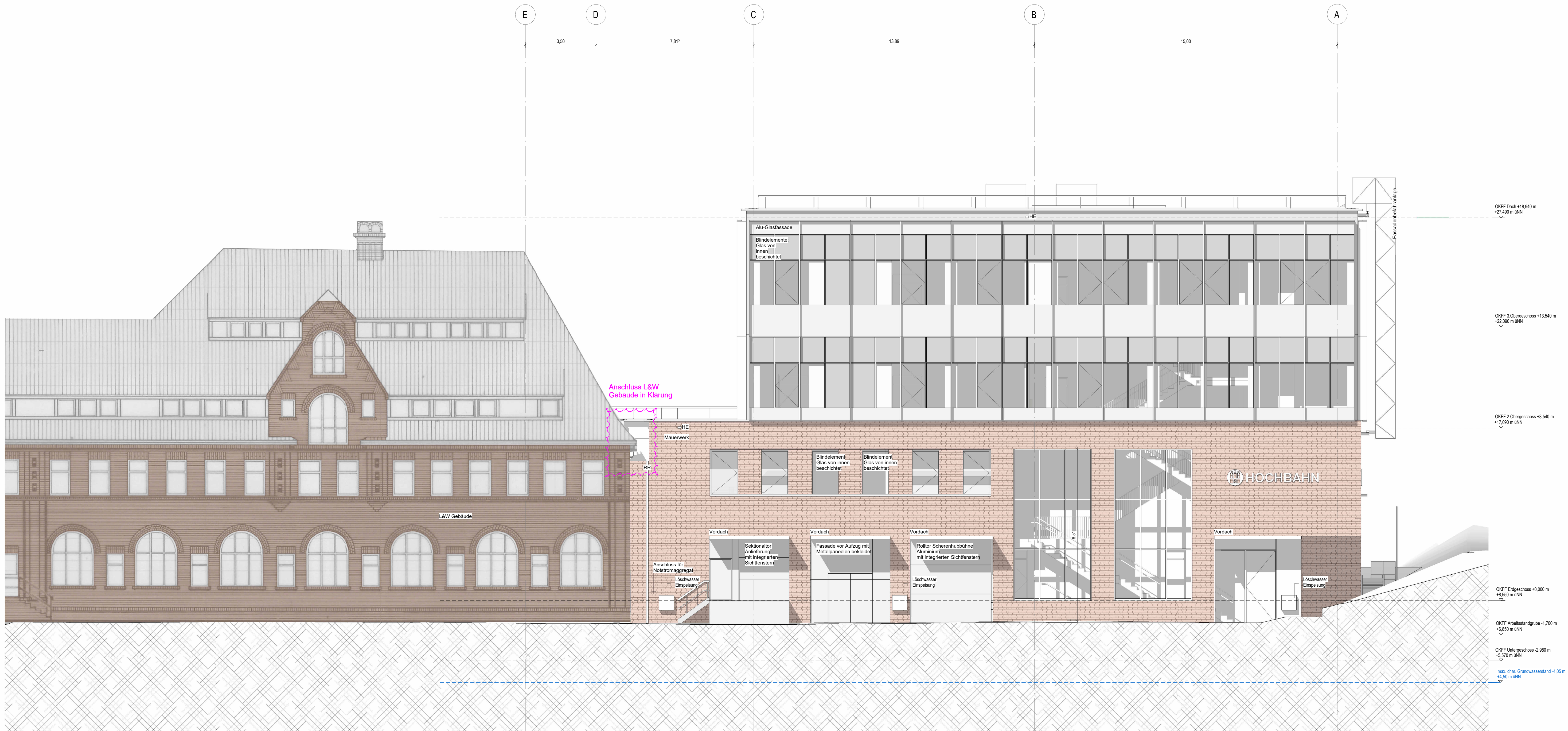
Ansicht West -

Zeichnungsverfasser: GÖSSLER KINZ KERBER SCHIPPMANN ARCHITEKTEN Gössler Kinz Kerber Schippmann Architekten PartG mbB Brauerknechtstr. 45 20459 Hamburg Tel +49 40 37 41 26 0 Fax +49 40 36 46 63 info@hbkpa.de / www.hbkpa.de